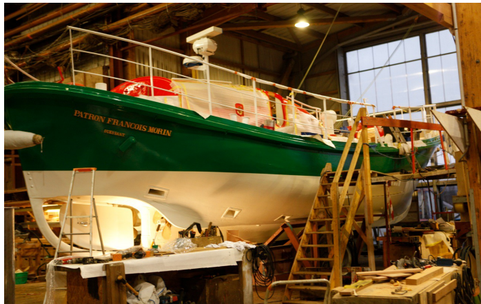
Restauration de « Patron François Morin »

La restauration de ces monuments historiques est placée sous le contrôle scientifique et technique de l'État, au travers des missions données par les Directions Régionales des Affaires Culturelles (DRAC) aux experts nationaux, et par l'action des conservations régionales des monuments historiques. Des subventions sont régulièrement accordées aux propriétaires qui doivent faire entretenir ou restaurer leur patrimoine.