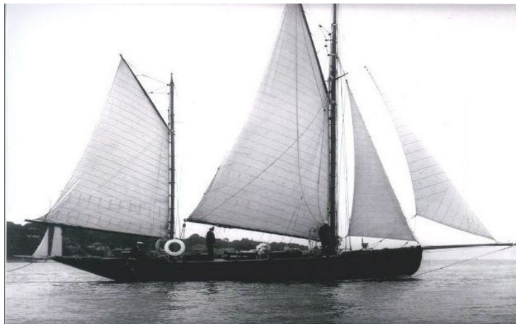
Swastika, classé monument historique

Le patrimoine nautique français peut s'enorgueillir de compter, à ce jour, 147 navires bénéficiant de la protection au titre des monuments historiques.